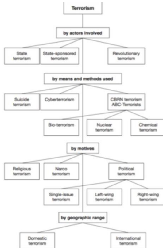
Figure 1 : « L'arbre typologique » de Löckinger (Marsden et Schmid, 2011)

Cet arbre permet d'organiser les différentes formes de terrorisme selon quatre catégories : acteurs impliqués, moyens, méthodes utilisées, les motifs et pour finir l'étendue géographique. Cette typologie permet d'analyser des « actes » terroristes en abordant des dimensions nouvelles comme les motifs et l'étendue géographique. Cet arbre prend en compte la dimension religieuse, il est intéressant de constater que le nombre d'attaques-suicides est en augmentation et qu'actuellement, les principaux groupes terroristes dans le monde revendiquent une cause religieuse. Les motivations idéologiques sont donc principalement au cœur des actions terroristes.